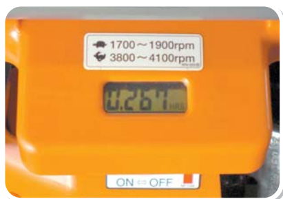
タコアワーマーター