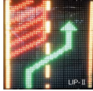
写真は、縦3枚×横3枚の9枚組み立て。 表示画面寸法：1,440×1,440mm（正方形）