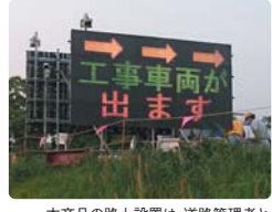
本商品の路上設置は、道路管理者と所轄警察署による協議が必要となる場合がありますのでご注意ください。