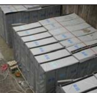
杭頭処理にも対応