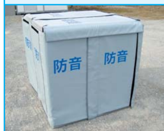
寸法:タテ1,200mm・ヨコ600mm・厚み60mm

小型機械(発電機やコンプレッサー等)に、リフォーム・改修工事等天井や高さ制限のある場所に。