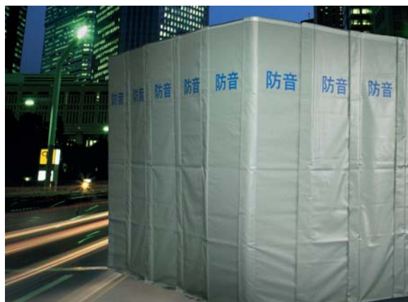
概略寸法:タテ2,700mm・ヨコ600mm・厚み60mm

隙間をできる限り無くすように囲んで下さい。 対象となる音が回り込まないように工夫してください。 風による飛散や転倒を防止するため、単管パイプ等で骨組み を建て、しっかり固定してください。