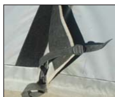
バンドとマジックテープで多様なサイズに対応可能