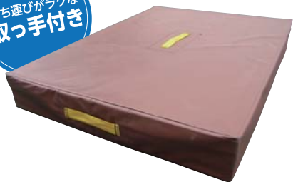
概略寸法：縦1,200×横900×厚さ150mm