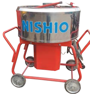
●ダマカットミキサー