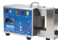
●ベアリングヒーター