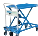
●テーブルリフト台車(250kg)