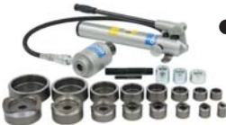
●パンチャー(厚鋼管用)