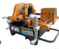
●電線管用ねじ切り機