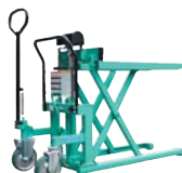
●ハンドパレットトラック(ハイリフト1t)