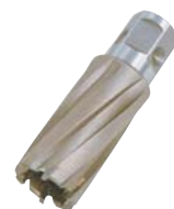
●ジェットブローチ