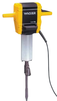
●EH23 Low Vib