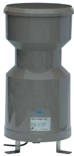
●転倒まず型雨量計/OW-34