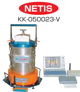
●生コン単位水量計/W-Checker