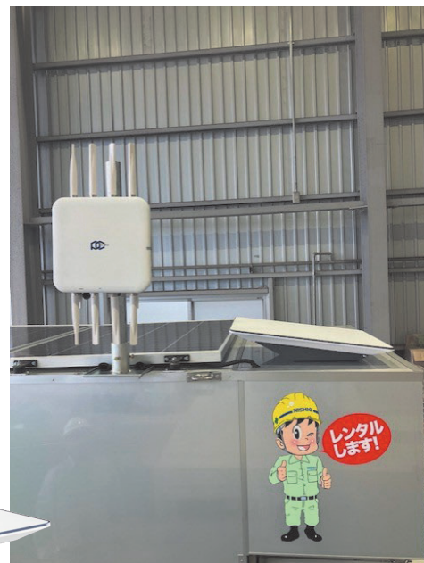
アンテナ設置イメージ