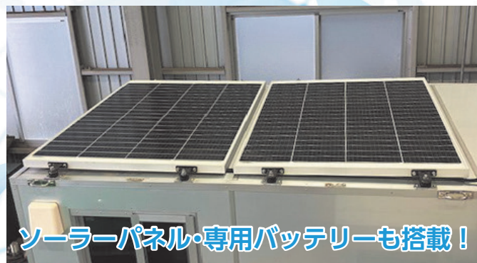
ソーラーパネル・専用バッテリーも搭載！

事務所BOXカーがバージョンアップ 山間部などでも通信環境構築可能 現場事務所や休憩室に最適