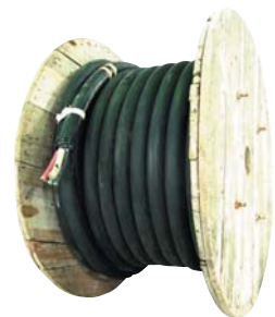
三相200V 60スケア(4芯) 30m