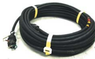
単相100V 2スケア(3芯) 20m

14~100スケア(4芯) 長さ 10m・20m・30m・50m ●両端剥き出し