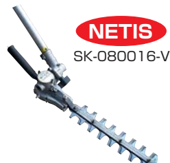
●安心トリマーくん