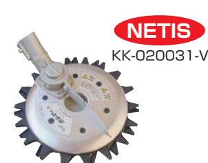
●スーパーカルマーα