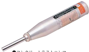
●コンクリートテストハンマー N型