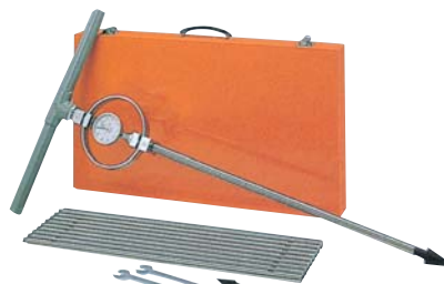
●コーンペネトロメーター