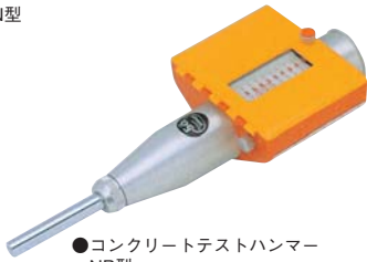
●コンクリートテストハンマー NR型