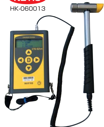
●コンクリートテスター CTS-02V4