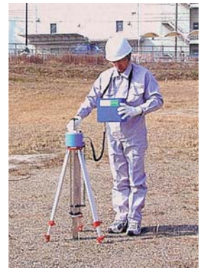
●簡易支持力測定器キャスポル