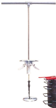
●スウェーデン式貫入試験機